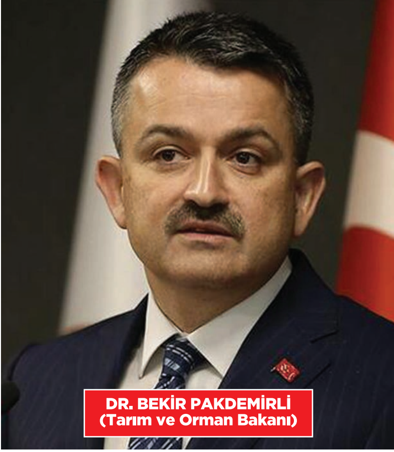
DR. BEKİR PAKDEMİRLİ (Tarım ve Orman Bakanı)