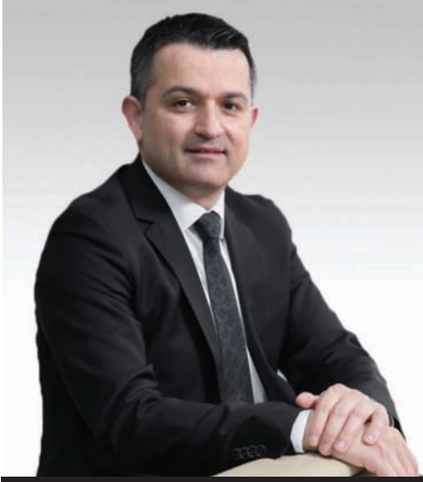
Dr. Bekir PAKDEMİRLİ Tarım ve Orman Bakanı