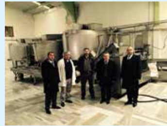
Şarköy Süt Ürünleri ve Gıda Malzemeleri Paz. Tic. Ltd. şirketine ait Şarköy Çiftlik tesisleri