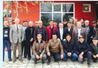
Muratlı İlçemize bağlı Aşağı Sevindik ve Yukarı Sevindik mahallelerinde çiftçi toplantısı