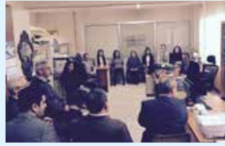
Çorlu ilçe müdürlüğümüz