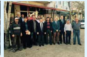
Malkara İlçemize bağlı Gözsüz, Karacahalil, Elmalı ve Balabancık Mahallelerinde çiftçi toplantıları