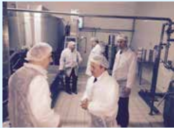
Özşifa Süt Ürünleri ve Sakarya Süt Ürünleri tesisleri