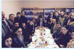
Şarköy ilçe müdürlüğümüzde sabah kahvaltısı