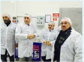
Et-Pa Gıda San. Ve Tic. Ltd. Şirketi-ne ait et ve et ürünleri tesisleri