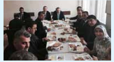
Çerkezköy ilçe müdürlüğümüzde sabah kahvaltısı