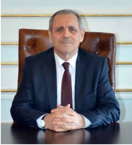
Enver SALİHOĞLU Tekirdağ Valisi