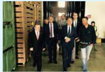
Çorlu İlçemizdeki modern meyvecilik tesisi