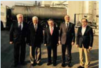
Kaanlar Gıda San. Ve Tic. A.Ş. ye ait Süt ürünleri işletmesi